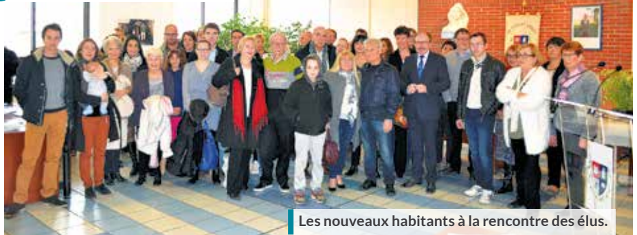
Les nouveaux habitants à la rencontre des élus.

L a cérémonie d'accueil des nouveaux habitants est toujours un moment fort dans la vie sociale de la commune. Traditionnellement placée quelques semaines après les vœux de la municipalité à la population, cette rencontre, plus intimiste et moins formelle, a rassemblé plusieurs familles qui ont fait le choix de s'installer à Saint-Genest-Lerpt. Cette cérémonie conviviale et décontractée participe à l'intégration de ces nouveaux Lerptiens pour les associer à la vie communale et son environnement de qualité.