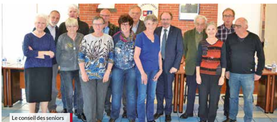
Le conseil des seniors

INFORMATION Pour contacter les membres du conseil des seniors : conseildesseniors@ville-st-genest-lerpt.fr